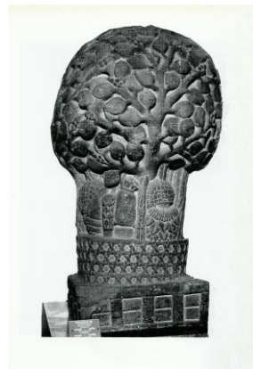
Kalpa-vriksha, Besnagar, 2e E vC