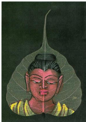
pipalblad met schildering van de Boeddha

Uiteraard is de Asvatta verbonden met de goden: afhankelijk van waar je bent wordt ze gezien als de woning of de belichaming van Brahma, Vishnu, en/of Siva, of ook wel van Lakshmi, en wordt op de corresponderende wekdagen vereerd. Verder wordt de boom als een Brahmaan gezien en als zodanig dagelijks gebaad en gekleed. De boom wordt ook met vuur en de vuurgod Agni geassocieerd, iets wat stamt uit Vedische tijden.